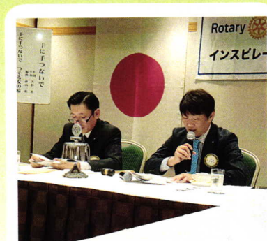
5月22日 夜間例会 次年度正副委員長会議