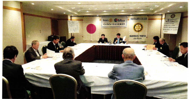
（会報担当者：深瀬 晃一 副委員長）