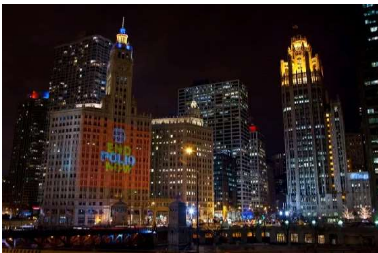
(ビルに写し出された EPN)

コロナ禍によりロータリーの活動や行事の実施が困難な状況となっておりますが、ロータリーは引き続きポリオ根絶を最優先目標として掲げています。10月24日の 世界ポリオデー には、例年、日本を含む世界中のクラブや地区がイベントを実施しており、今年もオンラインや三密を避けた活動など、工夫を凝らしてポリオへの認識向上や募金を行うことができます。