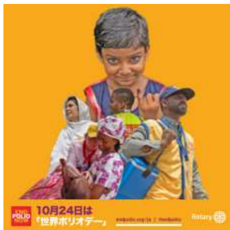
(今年から新しくなった公式ポリオポスター)