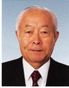
ガバナーエレクト たけべ のぶ 武部 實