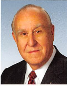
国際ロータリー会長 ジョンF.ジャーム